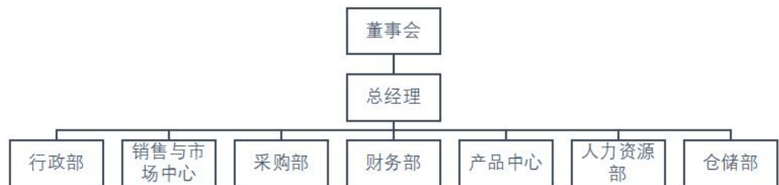
图 1 联盛公司组织机构图