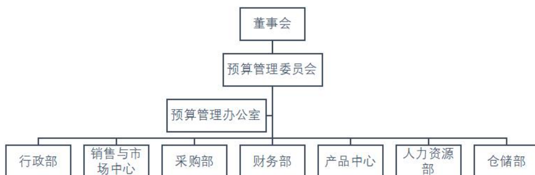
图2 预算管理组织机构图

北京联盛股份有限公司（以下简称：联盛股份）实行一年一期的年度预算编制，编制期为每年9月-12月。成立了由公司总经理担任主任，各部门最高负责人担任委员的预算管理委员会，如图2所示。此外，还设立了预算管理办公室，负责预算管理委员会的日常工作。预算管理办公室由财务部总经理担任主任。预算管理委员会负责公司预算管理的所有工作。9月中旬，预算管理委员会讨论公司下一年度的战略规划，制定策略目标和策略计划。10月初，分解策略目标给各部门、审议批准编制方法与程序。10月到11月为预算编制期。11月中旬，预算管理委员会审议预算初稿，平衡各部门预算。如有必要，调整预算目标。12月中旬，预算管理委员会审批并下达部门年度业务目标与业务计划、年度预算给各部门。年度预算编制完毕。