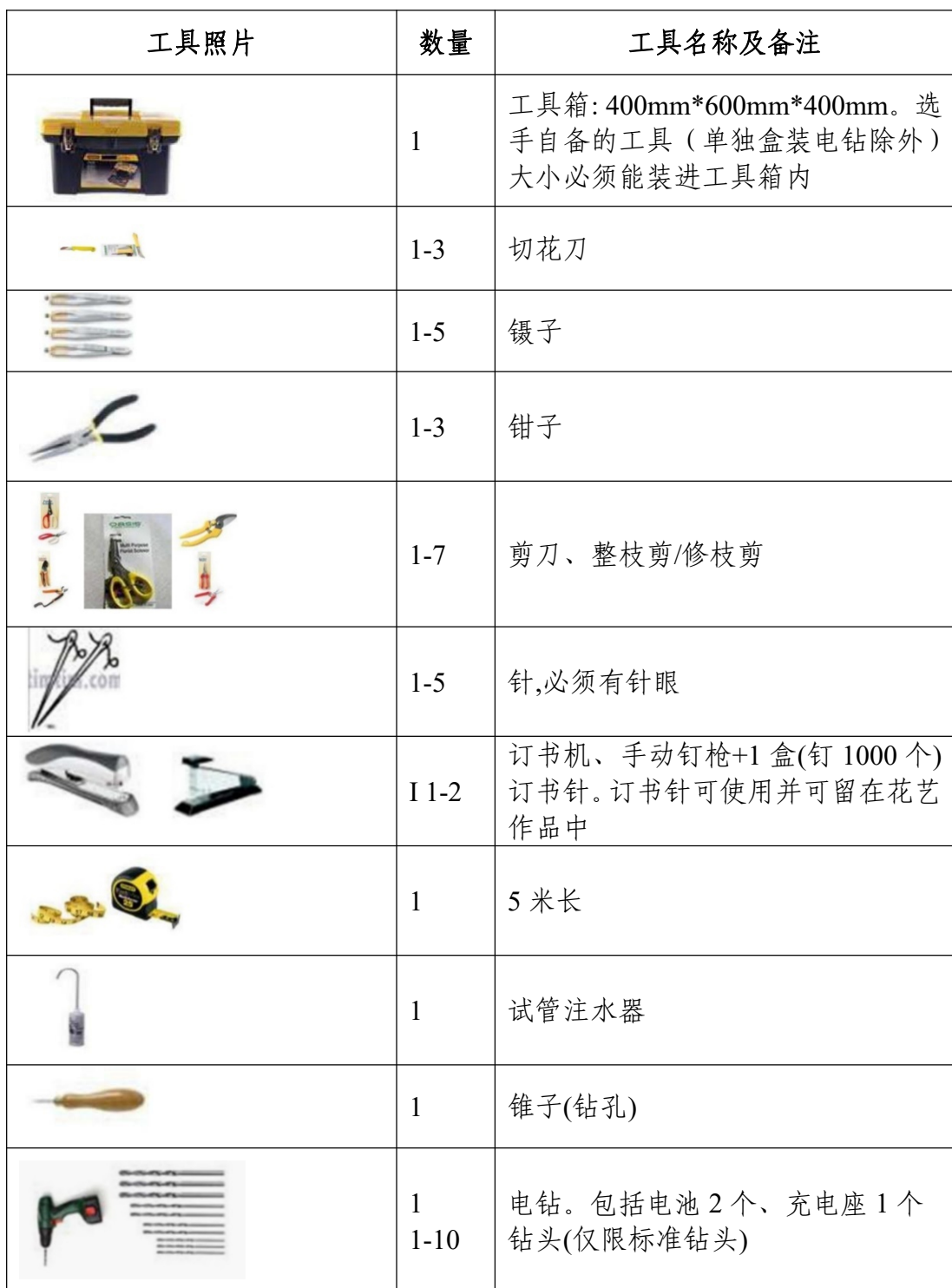
表 8 选手自备设备清单