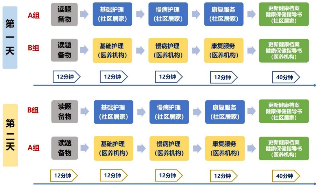
图 1 老年护理与保健场景、模块流程图