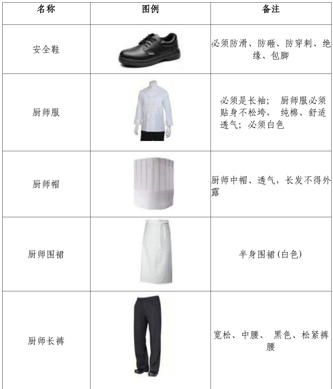
附件3 选手工装规范