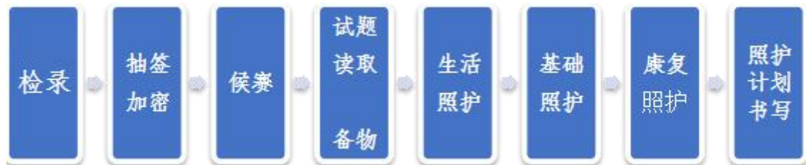
图2 参赛选手竞赛流程图

各参赛选手完成试题读取、备物后，持赛题案例、用物依次进入生活照护、基础照护、康复照护三个赛室，最后进入照护方案书写室。第一天、第二天竞赛流程一致。